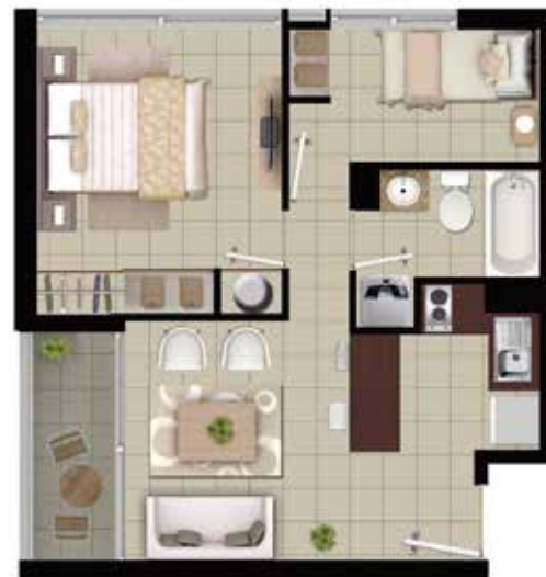
DEPTO TIPO A2 2 DORMITORIOS | 1 BAÑO