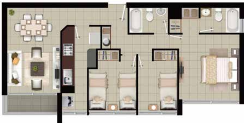
DEPTO TIPO D1 3 DORMITORIOS | 2 BAÑOS