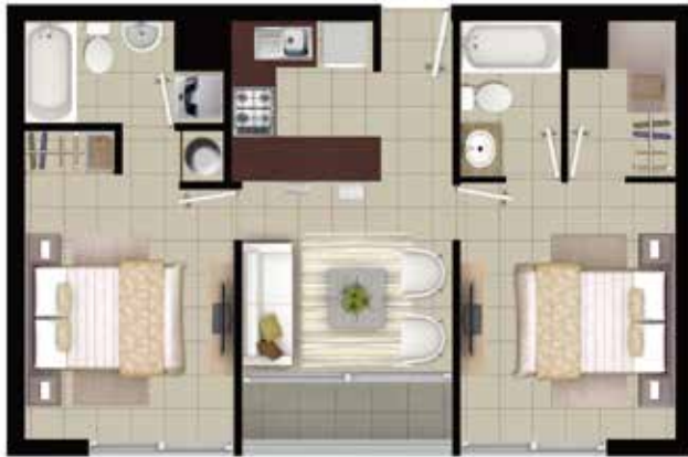
DEPTO TIPO B1 2 DORMITORIOS | 2 BAÑOS

Superficie: 46,27 m 2 INTERIOR 2,62 m 2 TERRAZA 48,89 m 2 TOTAL