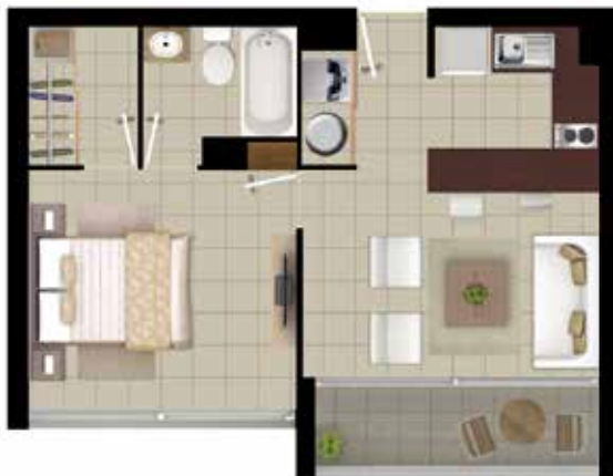
DEPTO TIPO A1 1 DORMITORIO | 1 BAÑO