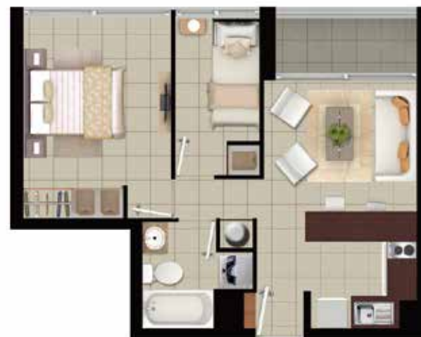
DEPTO TIPO E1 2 DORMITORIOS | 1 BAÑO