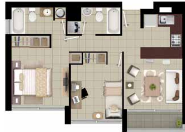
DEPTO TIPO B2 2 DORMITORIOS | 2 BAÑOS

Superficie: 46,27 m 2 INTERIOR 2,62 m 2 TERRAZA 48,89 m 2 TOTAL